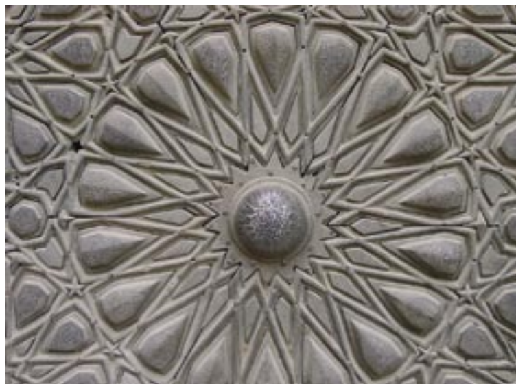
Mosquée Barquq. Le Caire. NDL.

Or, deux jours plus tard, il était enlevé, lui aussi. Puis par chance, ou pour une autre raison inconnue, libéré.