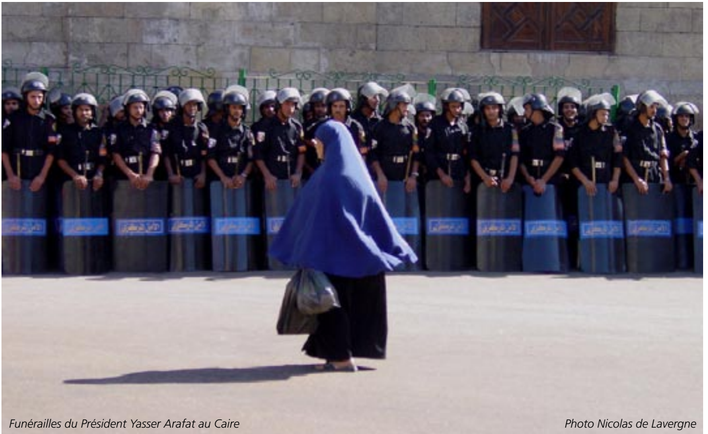
Funérailles du Président Yasser Arafat au Caire