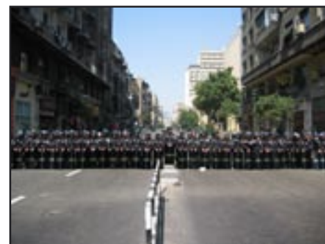
Barrage de police au Caire. I. El Amrani