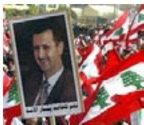
B. Assad, président syrien

De plus, le choix du moment de cet assassinat a toute son importance. Il n'y avait pas de conflit majeur manifeste au Liban, on était dans une période relativement paisible. La plupart des assassinats politiques passés ont eu lieu pendant la guerre civile, ce qui n'est pas le cas cette fois-ci.