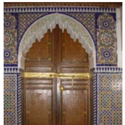
Porte ancienne, Marrakech. N. Kassimi

Al-Jaafari considère prématuré l'établissement d'un calendrier pour le retrait des troupes de la Coalition. «Quand nous aurons fini de bâtir des forces de sécurité irakiennes, nous demanderons aux forces étrangères de quitter l'Irak».