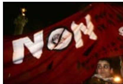
Manifestation des partisans du non à Paris

ce oblige», il faut «éviter à tout prix de signer l'arrêt de mort de l'Europe en marche» et remettre le wagon des 25 «sur les rails» (A. Djaad, La Tribune ). Après tout, l'UE ne connaît pas là sa première crise. Et surtout, il lui reste des chantiers internationaux à poursuivre, des promesses de partenariat à tenir. Les crises des uns ne doivent pas ralentir la marche des autres.