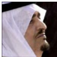
Le Roi Fahd

Né en 1921, le roi Fahd est monté sur le trône saoudien le 13 juin 1982, succédant à son demi-frère Khaled. Il est à la fois chef de l'Etat et chef du gouvernement. Dès son accession, il a désigné son demi-frère Abdallah comme prince régent et premier vice-premier ministre, tandis que son frère le prince Sultan devenait second vice-premier ministre.