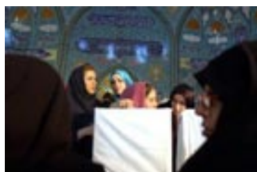
Femmes iraniennes au vote

Ce qui est le plus curieux à propos de cette élection est le caractère entièrement populiste et, en effet, socialiste, de la campagne. Il ne serait pas inexact de dire qu'on a employé le langage de la lutte des classes. La difficulté consiste maintenant à concilier la campagne électorale avec la réalité du pouvoir. Si le gouvernement veut tenir ses promesses, alors il doit s'attaquer aux élites marchandes corrompues qui constituent un pilier important du régime, au même titre que ses propres supporters. La logique d'une telle politique serait l'ultime démantèlement de l'accord politique mis en place par Rafsandjani après 1989 et – ironie de l'histoire – la réalisation de ce que Khatami essayait de faire, certes d'une manière plus douce et moins directe ! Ce qui est probable, c'est qu'Ahmadinejad utilisera l'argent du pétrole pour financer des subventions et s'attaquera de manière ciblée à certains membres-clés de l'élite marchande, comme Poutine l'a fait en Russie. Bien sûr, cette opération doit être menée délicatement. L'Iran n'est pas la Russie.