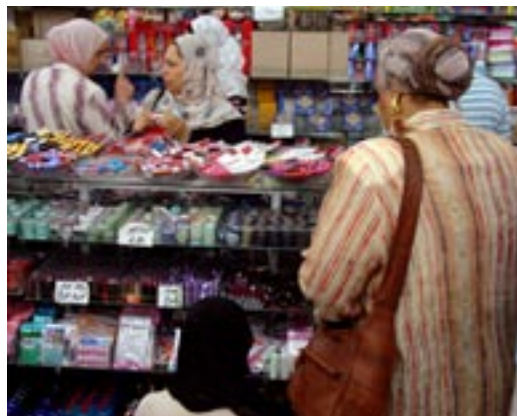
Marchand de produits de beauté au Caire N. de Lavergne

La femme arabe est devenue une véritable consommatrice effrénée de parfums et de maquillages. Dans certains pays musulmans où le port du voile est imposé par la loi, l'Iran par exemple, les femmes aisées se sont même mises à porter des voiles et des tenues qui soient assorties aux couleurs du maquillage pour paraître plus chic et plus féminines, parfois même avec un maquillage presque aguichant. Si la femme voilée