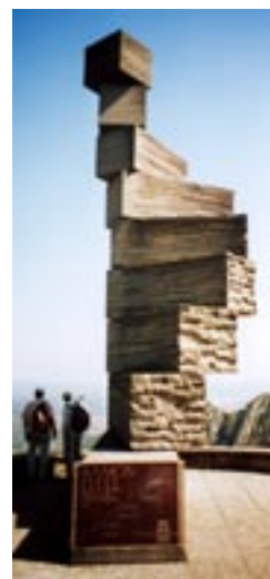
Monument à Ramon Llull au monastère de Montserrat (Catalogne)

On peut lire aujourd'hui avec profit son premier ouvrage, Le Livre du gentil et des trois sages (1270), antérieur à sa période «unificatrice»: il y dépeint un Gentil, c'est-à-dire un non-croyant, au caractère très moderne, qui souffre à l'idée de disparaître après sa mort, et qui est réconforté par trois Sages représentant chacun l'une des religions monothéistes et s'associant pour lui montrer le bien-fondé de leur foi en la résurrection.