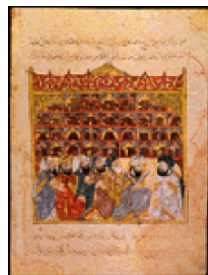
Al-Hariri (1054-1122) Une bibliothèque à Bassora, Al-Maqâmât (Les Séances)

On pourrait dire en somme que des hommes appartenant à des minorités, s'appuyant sur une langue de transition, ont accompli une œuvre durable qui a contribué au prestige d'une grande civilisation. ■