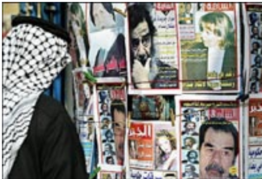
Un Irakien lisant la «une» des journaux.

Le nombre des journaux irakiens a dépassé les 260, dont seulement 71 sont autorisés par le syndicat irakien des journalistes. Quant à la télévision, selon un rapport publié dans le Los Angeles Times , 65% des Irakiens ont accès aux antennes satellitaires et peuvent recevoir plusieurs chaînes. Les immeubles du pays sont désormais ornés de récepteurs satellitaires qui marquent la fin de plus de 35 ans de monopole. Le rapport du Los Angeles Times indique qu'il existe à l'heure actuelle plus de 20 chaînes de télévision qui se livrent une rude concurrence pour gagner des spectateurs. Grâce aux excellentes installations de Dubaï Media City, deux importantes chaînes satellites irakiennes, Al-Sharqiya et Al-Fayhaa, diffusent depuis Dubaï. Pour Abdel Satir Jewad, ancien chef du Département des communications à l'Université de Bagdad et rédacteur en chef du Baghdad Mirror , la multiplication des chaînes en Irak est une réaction naturelle à la fin de l'ère Saddam.