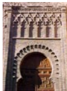
Sinagoga de Santa Maria la Blanca

Il reste que l'engouement des universités européennes naissantes pour Aristote (et Platon, Hippocrate, Héraclite, Ptolémée,...) ne s'explique pas sans les travaux de «nos Tolédans», malgré leur infidélité. Ces travaux ont suscité d'abord l'intérêt de l'Occident pour l'antiquité grecque, puis le désir d'en avoir une connaissance directe, d'avoir accès sans intermédiaire à des textes aussi authentiques que possible. C'est après la prise de Constantinople par les Ottomans en 1453 et l'émigration de nombreux lettrés byzantins, en premier lieu vers l'Italie, que pour la première fois depuis l'empire romain on traduira enfin, directement et