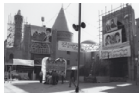
Etude de l'architecture de la période islamique en Iran d'après une source inédite: le Fonds Viollet.