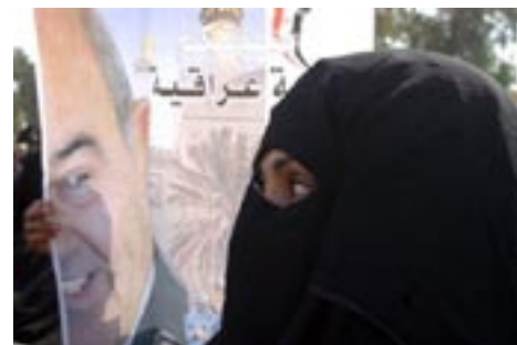
Iyad Allaoui.

Iyad Allaoui, né 1945, est membre de l'élite chiite laïque de l'opposition en exil. Après avoir adhéré au Baath, il en sort en 1975 à la suite d'un désaccord, dès le début des années 70, avec Saddam Hussein. En 1978, il échappe à une tentative d'assassinat à Londres. En 1991, avec l'appui de la CIA et du MI6, il fait partie des cofondateurs de l'Iraqi National Accord (INA, Parti de l'entente irakien), groupe d'opposition formé surtout de baathistes déçus issus des milieux militaires irakiens. L'INA est connu pour avoir fomenté un coup d'Etat militaire en Irak dans les années 90. Allaoui et l'INA sont également impliqués dans la transmission aux services secrets britanniques du tristement célèbre faux dossier, fourni par un officier irakien, sur les armes de destruction massive potentiellement détenues par le régime en place à Bagdad.